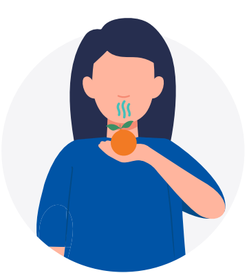
PÉRDIDA DEL GUSTO O DEL OLFATO

No ingrese al hospital si tiene dos (2) de los siguientes síntomas: