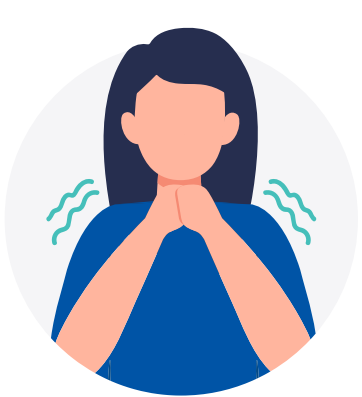
TEMBLORES O ESCALOFRÍOS